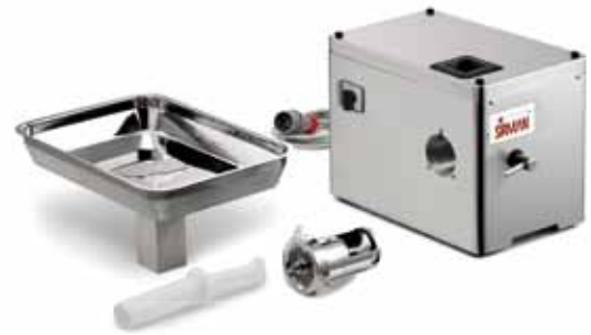
绞肉端部和料斗可拆卸