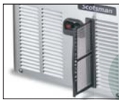
可拆卸的冷凝器滤网