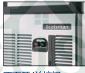
正面开/关按钮 故障报警功能