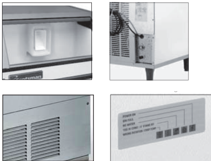
SS AISI 304